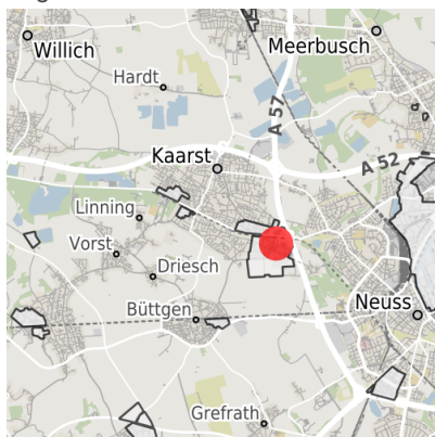
Lage in der Kommune