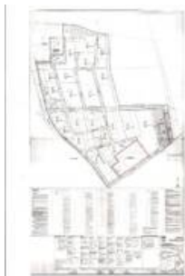
BPlan GG Hackenbroich Gesamt.jpg