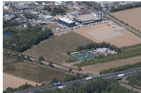
Gewerbegrundstück Bergiusstraße - Vogelperspektive mit Autobahn A 57