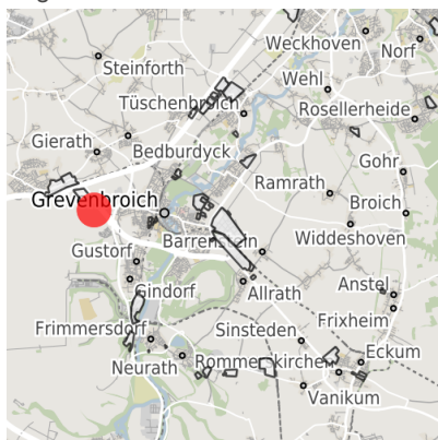
Lage in der Kommune