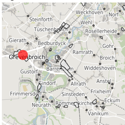
Lage in der Kommune