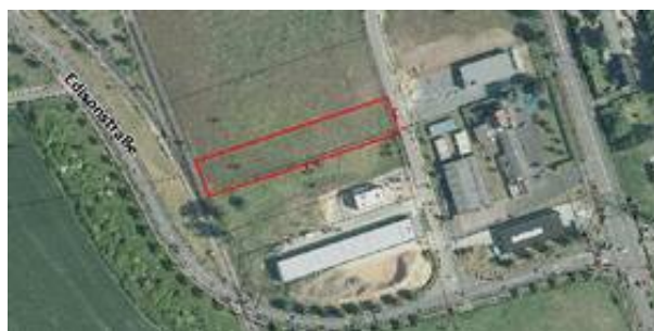
Verfügbare Flächen Borsigstraße.jpg