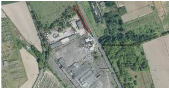
Gewerbegrundstück Düsseldorfer Str. 87