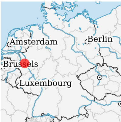
Lage in Deutschland