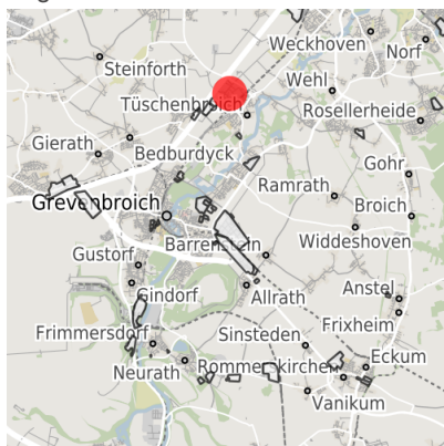
Lage in der Kommune