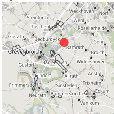
Lage in der Kommune