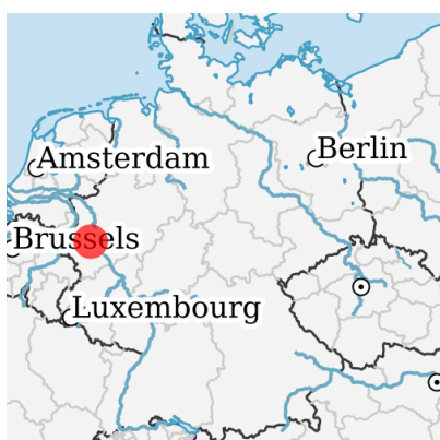
Lage in Deutschland