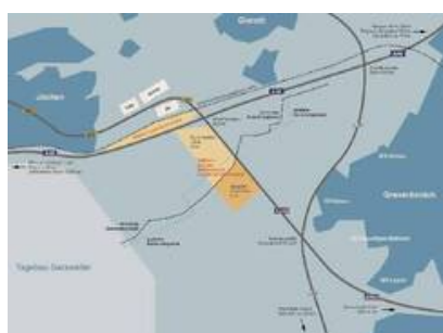
Interkommunales Gewerbegebiet Juechen-Grevenbroich