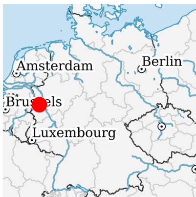
Lage in Deutschland