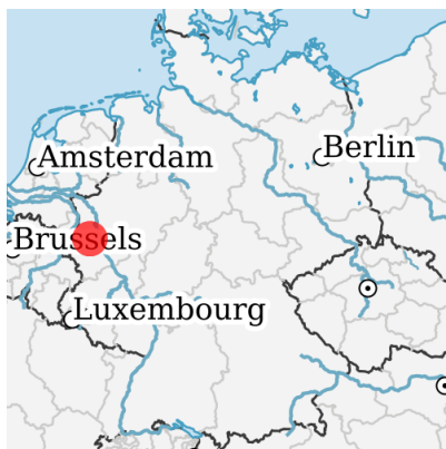
Lage in Deutschland